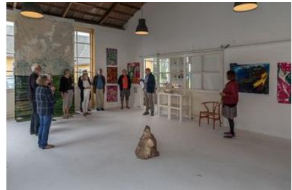
Galleri Ewald, Møn