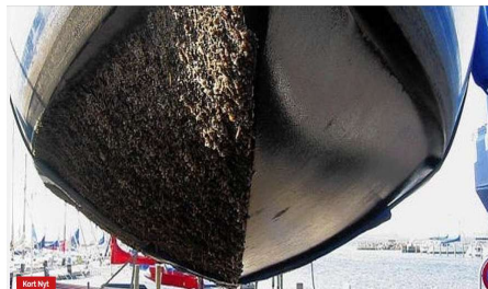
Rens bådens bund med tørís - det er effektivt, skånsomt og miljøvenligt

Blæsning med tørís eller tørísblæsning er meget at sammenligne med sandblæsning, men der anvendes dog ikke sand, men uskadelig tørís. Det har den meget store og helt centrale fordel, at tørísen ikke beskadiger eller slider på de overflader, som afrenses. Der er således ingen slitage, ridser eller andet efter tørísblæsning – kun en helt ren og tør overflade uden noget restprodukt.