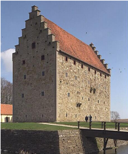
Borgen Glimmingehus ligger 12 km sydvest for Simrishamn

Årets studietur var planlagt til Kristianstad i Skåne. Rejselederen tog en prøvetur ugen før og fandt ud af, at der var rigtigt meget vejarbejde direkte til Kristianstad. Derfor ændredes turen lidt til først at gå til Glimmingehus, der ligger ved den svenske østkyst. Det er en imponerende borg fra år 1499 med 2,40 m tykke mure og indrettet som de boede for 800 år siden. Et imponerende sted