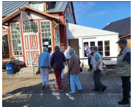
Frokosten blev indtaget på Åhus Bryggeri.