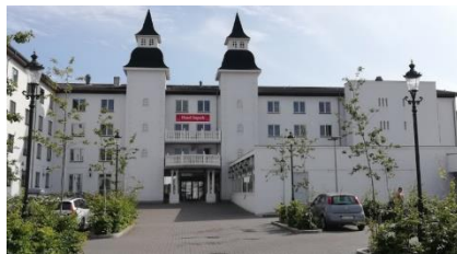
Vores hotel i Maribo med pool og fitnessrum samt udsigt over Sønder sø

På hotellet spiser vi også hyggelig fælles aftensmad samt selvfølgelig også morgenmad.