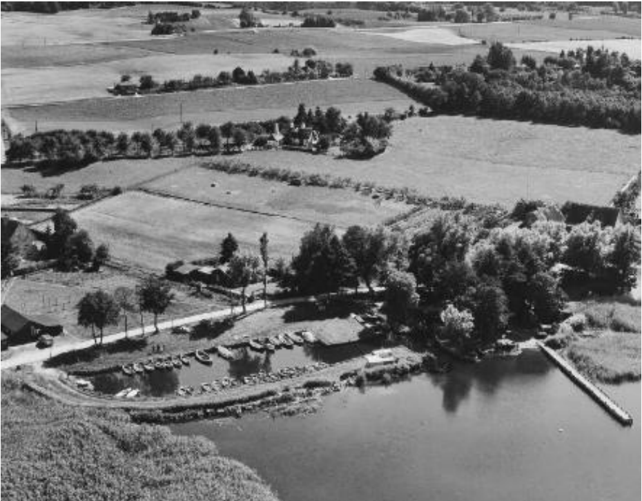
Sørup Havn, 1957.

På billedet ses det nuværende indre bassin anlagt omkring 1955 af fiskeforpagter Oscar Andersen. Det anlagte havnebassin blev benyttet til 10-15 både, som han selv udlejede samt Lystfiskeriforeningens ca. 10 både.