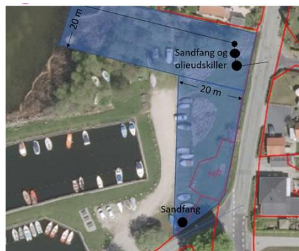
Rørende lægges ved den lange lige streg øverst i billedet.

I efteråret 2019 vil Fredensborg Kommune etablere et nyt afløb fra Sørupvej og direkte ud i søen. Tidligere løb det ud i havnen og medvirkede til sandopfyldning i yderhavnen. I anlægsperioden ønsker man at disponere over de blå felter herunder i en måneds tid. Det kan bl.a. gå ud over p-pladser, men vis venligst hensyn.