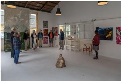
Galleri Ewald, Møn