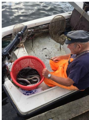
Ålefiskeri i Hørby Havn

Frokosten blev indtaget i den lille hyggelige havn Hørby, som har egen færgekro. I havnen bliver der stadig landet ål som det ses herunder.