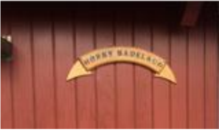
Bådelaugets logo i udskåret træ.

Det er jo altid godt at få inspiration på studieture... bl.a. så vi dette flotte navneskilt i udskåret træ! Sådan et tror jeg godt vi kunne ønske os også i vores bådelaug. Hvem kan sådan noget?