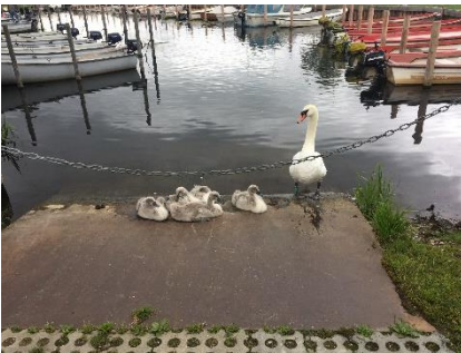
Svanefamilien var også med til receptionen

En musiker sørgede for den gode stemning med sømandsviser, ligesom der blev sunget Sørup Visen skrevet af Susan Axholt.