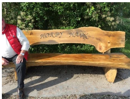
Bænk med navn på

Hørby Havn har plads til 90 både og har deres eget bådelag, der er meget aktivt og med stor medlemsopbakning ligesom i vores havn.