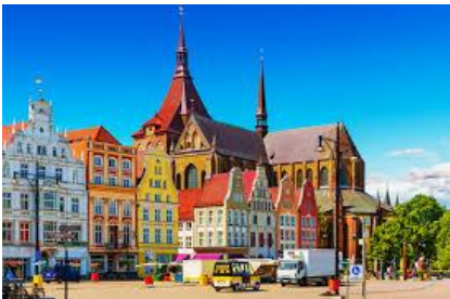
Hansestæderne rummer mange flotte huse

Tilmelding skal ske direkte til formanden på af@fisker.dk, senest den 1. juni 2019.