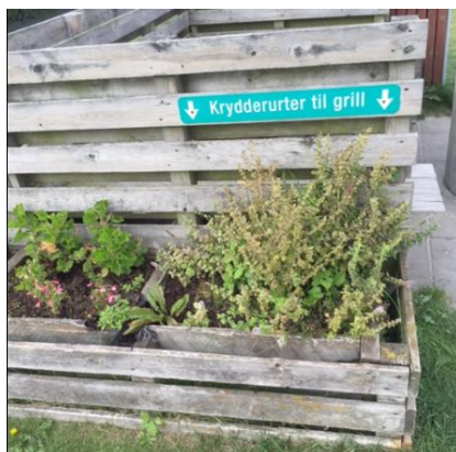
Ide fra Kerteminde Havn, hvor der ved grillpladserne er gratis krydderurter til grillen. Måske en idé til Sørup Havn?

Dernæst var der ølsmagning og frokost på Tornøes Hotel lige ved siden af. Hold da op en god historie og noget godt øl vi fik lov til at smage i rigelige mængder og stemningen var sat resten af dagen. Siden så vi det skønne Johannes Larsen Malemuseum, hvor især hans fuglebilleder er utroligt flotte. Inden hjemturen fik vi serveret kaffe og hjemmebagte kager i haven. Ved hjemkomsten var der efterslukning i Hyttedefadet, og alle kunne gå hjem med en god oplevelse i bådelaavets regi.