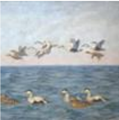
Maleri af Johannes Larsen

Oplev havets magi på Fjord & Bælt i selskab med en fascinerende formidler, der vil føre os fra kæmpe hvalskeletter og små krabber til levende og helt unikke sæler og marsvin.