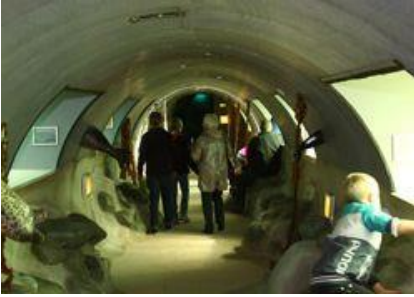
Kig under havet i Fjord og Bælt

Oplev havets magi på Fjord & Bælt i selskab med en fascinerende formidler, der vil føre os fra kæmpe hvalskeletter og små krabber til levende og helt unikke sæler og marsvin.