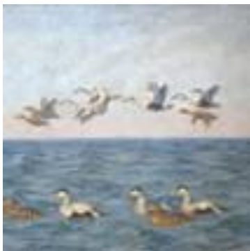
Maleri af Johannes Larsen

Tilmelding til havnefogeden på mail: soeruphavn@gmail.com