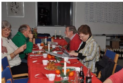
Julebanko er et tilløbsstykke

Hyggeligt julemøde med mulighed for at vinde juleanden og den store gavekurv samt mange andre gode sager.