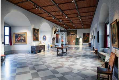
Riddersalen på Malmöhus Slott

Rent museums-mæssigt er det udformet meget informativt, og som dansker er det rigtig interessant at se. Deltagerne får en rigtig god oplevelse.