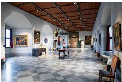
Riddersalen på Malmöhus Slott

Rent museums-mæssigt er det udformet meget informativt, og som dansker er det rigtig interessant at se. Deltagerne får en rigtig god oplevelse.